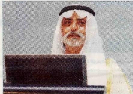
نعيان بن مبارك يلقي الكلمة الافتتاحية للمؤتمر في أبوظبي أمس (الربيع)