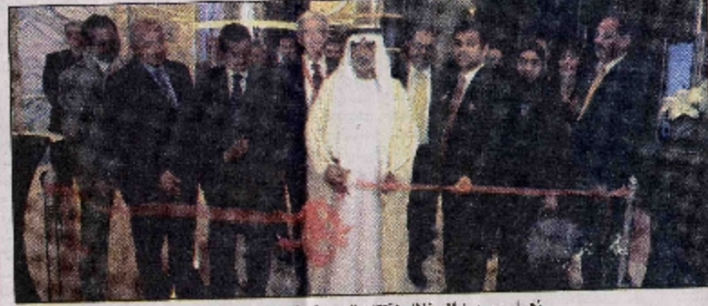
نهيان بن مبارك خلال افتتاح المعرض المصاحب للمؤتمر

مهمة في دولة الإمارات العربية المتحدة والعالم أيضاً أن الدعم المقدم من قبل الحكومة وكذلك من قبل الجهات الشريكة معنا يعزز من أهمية ونور ومشاركة كل مختص في علم الأورام.