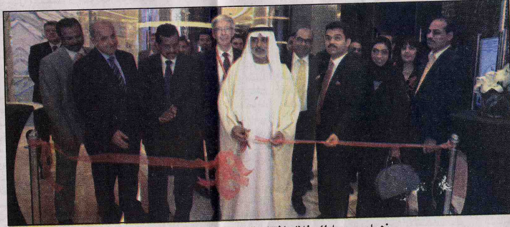
نهيان بن مبارك خلال افتتاح المعرض المصاحب للمؤتمر

المنتدب لـ "مستشفى برجيل" ومستشفى إلال اتش، تماشياً مع مسيرة أبوظبي الرامية إلى تحقيق الرؤية الاقتصادية ٢٠٣٠، والتي أطلقتها القيادة الحكيمة أن تتوافق بإنجازات مهمة وواضحة في قطاع