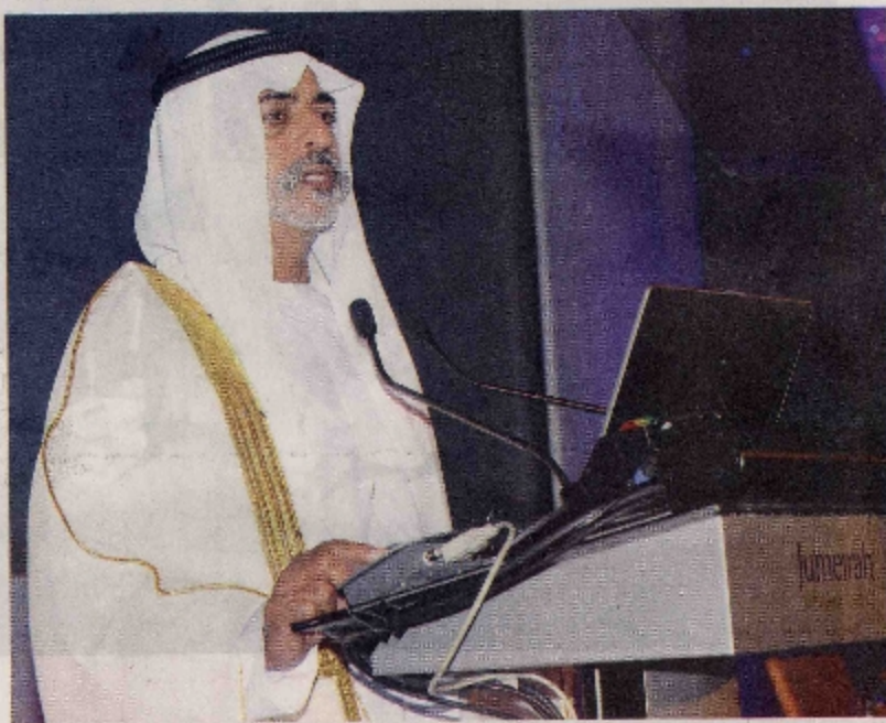
نهيان بن مبارك خلال إفتتاح المؤتمر

نعمل من أجل الحصول على أفضل التكنولوجيات المتقدمة لمحاولة اكتشاف المرض في مراحله المبكرة