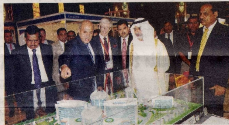
نهيان بن مبارك خلال جولة في فعاليات المعرض للمنتجات

بالسرطان وأشاد معاليه في ختام كلمته بالجهود التي يبذلها مجتمع الرعاية الصحية الذي اجتمع أمس في مؤتمر علم الأورام الدولي. وقال من فضلكم أعرفوا بأننا نحن الجمهور ممثلون كثير لكم ممنون بخيراتكم ومهاراتكم وشعاطفكم وجهودكم الدؤوبة التي تستحق الملقب بالإبداع وإنما معجبون وعقرون كذلك لتصميمكم على نشر التوعية والتثقيف بمرض السرطان. من جانبها قال الدكتور شمشير قائلاً رئيس المؤتمر والعضو المنتدب للمستشفى برجيس ومستشفى ال ال اكتش انه ماشياً مع مسيرة أبوظبي الرامية إلى تحقيق الرؤية الاقتصادية