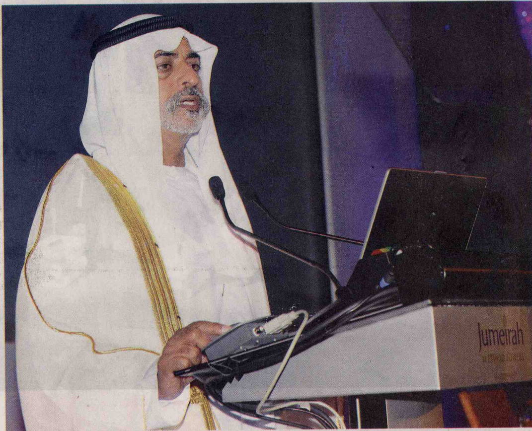
نهيان بن مبارك خلال إلقاء كلمته

وتجري فعاليات هذا الحدث التعليمي الكبير بتنظيم من اللجنة العلمية اللجنة المنظمة وبدعم من مدينة برجيل الطبية وعدد من الرعاة الرئيسيين مثل طيران الاتحاد وروش أطلس الطبية وسانفوي للأورام وفاريان للأنظمة الطبية ومؤسسة المختبر المرجعي الوطني إضافة إلى العديد من شركات المستحضرات الصيدلانية .