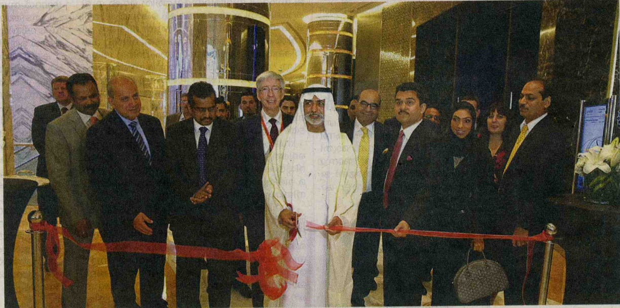
ബർജിൽ മെഡിക്കൽ സിറ്റിയുടെ കീഴിൽ അബുദാബി ഇത്തിഹാദ് ടവറിൽ നടന്ന പ്രഥമ രാജ്യാന്തര അർബുദ സമ്മേളനം യു.എ. ഇ സാംസ്കാരിക-യുവജന കാര്യ-സാമൂഹിക വികസന മന്ത്രി ശൈഖ് നഹ്യാൻ ബിൻ മുബാറക് അൽ നഹ്യാൻ ഉദ്ഘാടനം ചെയ്യുന്നു

അർബുദത്തിനെതിരെയുള്ള പ്രതിരോധ-ബോധവൽകരണ പ്രവർത്തനങ്ങൾ വ്യാപിപ്പിക്കുമെന്ന് സമ്മേളന സമിതി ചെയർമാനും ബർജിൽ മെഡിക്കൽ സിറ്റി ഡയറക്ടറുമായ