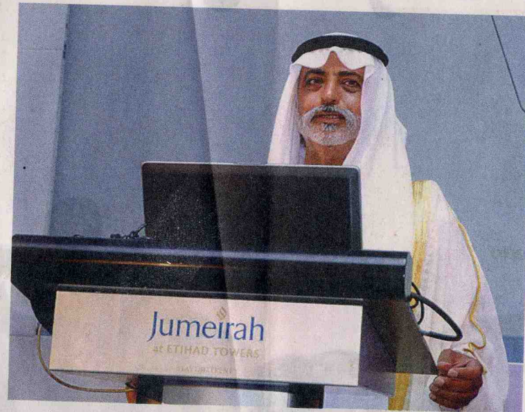
نهيان بن مبارك خلال افتتاح المؤتمر

وأضاف معاليه "إننا في دولة الإمارات نشارك مجتمع الرعاية الصحية العالمي ونسير معه جنباً إلى جنب في جهوده الرامية إلى مواجهة مختلف التحديات التي يفرضها مرض السرطان، سواء من حيث تعزيز الوعي بهذا المرض والأليات الكفيلة بعلاجه، أو من حيث توفير الفرص البحثية والتدريبية التي تعزز من تلك الجهود وتدفعها إلى الأمام". منوهاً بأنه في سبيل تحقيق ذلك فإنه من الأهمية بمكان أن