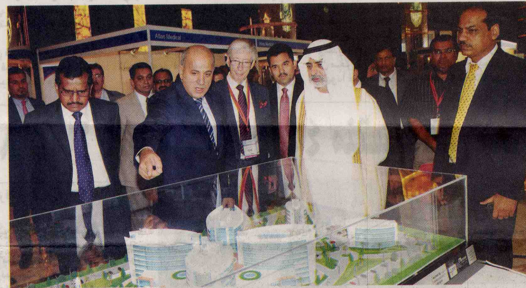
نهيان بن مبارك خلال جولة في الفعاليات المصاحبة للمؤتمر

بالسرطان . وأشاد معاليه في ختام كلمته بالجهود التي يبذلها مجتمع الرعاية الصحية الذي اجتمع امس في مؤتمر علم الأورام الدولي .. وقال " من فضلكم اعرفوا بأننا نحن الجمهور ممنونون كثيرا لكم ممنونون لخبراتكم ومهاراتكم وتعاطفكم وجهودكم الدؤوبة التي تستحق بالفعل الإشادة والإعجاب إننا معجبون ومقدرون كذلك لتصميمكم على نشر التوعية والتثقيف بمرض السرطان ."