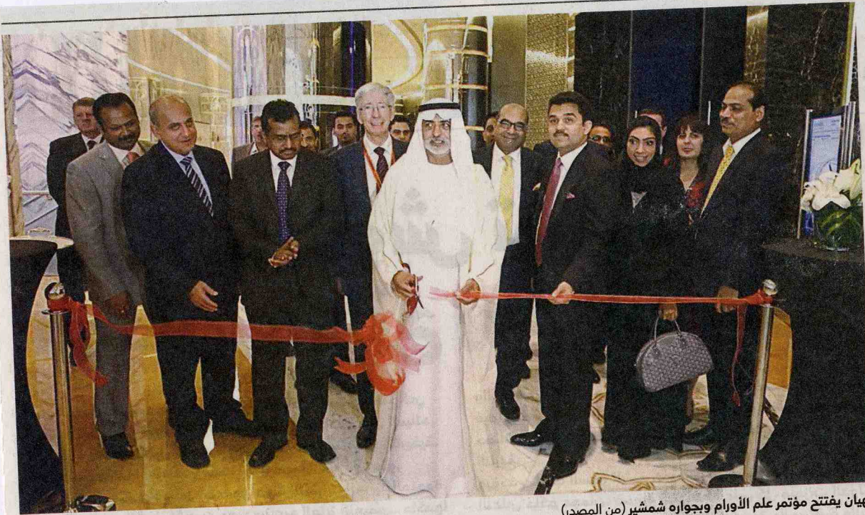
نهيان يفتتح مؤتمر علم الأورام وجواره شمشير (من المصدر)

H.E. Nahayan Mabarak Al-Nahayan inaugurates International Oncology Conference in Abu Dhabi