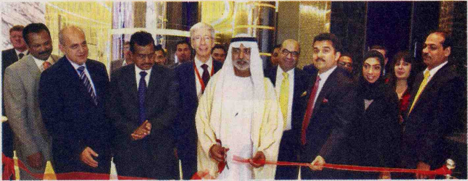
അബുദബിയിൽ ആരംഭിച്ച അന്താരാഷ്ട്ര ഓങ്കോളജി സമ്മേളനം യു.എ.ഇ സാംസ്കാരിക-യുവജന-സാമൂഹിക വികസന മന്ത്രി ശൈഖ് നഹ്യാൻ ബിൻ മുബാറക് ആൽ നഹ്യാൻ ഉദ്ഘാടനം ചെയ്യുന്നു

അബുദബി: അർബുദം നേരത്തേ കണ്ടെത്തുകയും രോഗത്തെ തടയുന്നതിനും ലക്ഷ്യം വെച്ച് ആരംഭിച്ച അന്താരാഷ്ട്ര ഓങ്കോളജി സമ്മേളനത്തിന് അബുദബിയിൽ തുടക്കമായി. അർബുദ ചികിത്സാ നിലവാരം ഉയർത്തുക, രോഗം തിരിച്ചറിയുക, രോഗം ബാധിക്കുന്നത് തടയുക എന്ന മുദ്രാവാക്യവുമായി ആരംഭിച്ച സമ്മേളനം യു.എ.ഇ സാംസ്കാരിക-യുവജന-സാമൂഹിക വികസന മന്ത്രി ശൈഖ് നഹ്യാൻ ബിൻ മുബാറക് ആൽ നഹ്യാൻ ഉദ്ഘാടനം ചെയ്തു. അമേരിക്ക, ബ്രിട്ടൻ, ഇന്ത്യ, യു.എ.ഇ തുടങ്ങിയ രാജ്യങ്ങളിൽ നിന്നുള്ള വിദഗ്ധരും 500ലധികം ആരോഗ്യ മേഖലാ പ്രവർത്തകരും സമ്മേളനത്തിൽ പങ്കെടുക്കുന്നുണ്ട്. സയൻറിഫിക് കമ്മിറ്റിയുടെയും ബുർജിൽ മെഡിക്കൽ സിറ്റിയുടെയും സംയുക്താഭിമുഖ്യത്തിലാണ് സമ്മേളനം സംഘടിപ്പിച്ചിരിക്കുന്നത്. ലോകത്ത് മരണകാരണമാകുന്ന രോഗങ്ങളിൽ പ്രധാനപ്പെട്ടതാകുന്ന അർബുദത്തിനെതിരെ ഒത്തൊരുമിച്ചുള്ള പോരാട്ടം അനിവാര്യമാണെന്ന് ശൈഖ് നഹ്യാൻ ബിൻ മുബാറക് പറഞ്ഞു. നല്ലൊരു ശതമാനം അർബുദവും നേരത്തേ തിരിച്ചറിഞ്ഞാൽ ചികിത്സി