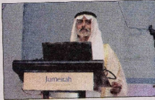
.. ويلقي كلمته خلال حفل الافتتاح

من بين المتحدثين في المؤتمر رواد وخبراء عالميين من الولايات المتحدة، المملكة المتحدة، النمسا، مصر، الهند، ومن دولة الإمارات العربية المتحدة من بين بعض المتحدثين البارزين فذكر الدكتور تشارلز بوديل من المملكة المتحدة، الدكتور جيمس مورري من الولايات المتحدة، الدكتور كارين س. كيب، من النمسا الدكتور إريك تشولزني شهادة البورد الأمريكي، الدكتور عيسن مختار، من مصر، والدكتور حارة شاتورفيد من الهند