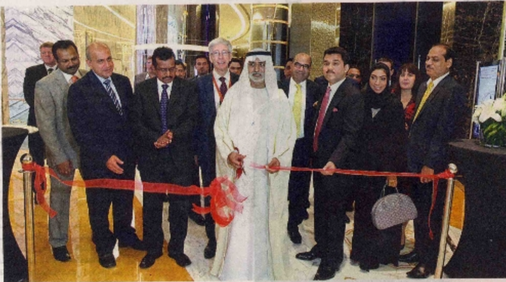
نهيان بن مبارك يقص الحزبم التقديم