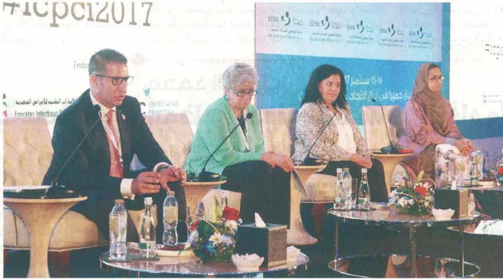
متحدثون في إحدى جلسات المؤتمر

انطلقت أمس، فعاليات المؤتمر الدولي الأول للوقاية من العدوى ومكافحتها في العاصمة أبوظبي، بتنظيم من شركة أبوظبي للخدمات الصحية «صحة»، في فندق جميرا في أبراج الاتحاد، وأوضحت رئيسة المؤتمر الدكتورة نوال الكعبي، استشارية الأمراض المعدية للأطفال ومديرة إدارة الشؤون الطبية في مدينة الشيخ خليفة الطبية، أن الدورة الأولى لمؤتمر الوقاية من العدوى ومكافحتها يأتي تحت شعار «الوقاية والابتكار وإنقاذ الأرواح»، واستطاع استقطاب خبرات عالمية في المجال من أميركا وأوروبا والشرق الأوسط والخليج العربي، بالإضافة للخبرات المحلية، حيث تجاوز حضور المؤتمر الـ 700 مشارك، مشيرة إلى أن المؤتمر ركز خلال محاضراته على سياسات هيئة الصحة في مكافحة العدوى والجودة، والتركيز على أساسيات مكافحة العدوى، والتي يجب أن يكون كل عامل في القطاع الصحي ملماً فيها.