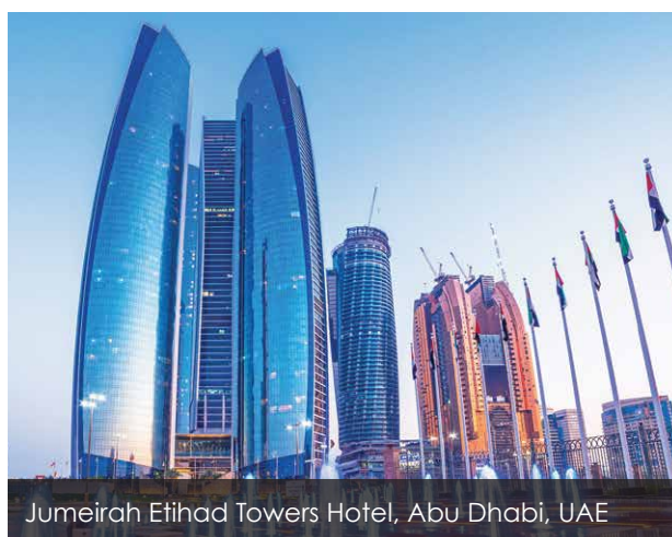
Jumeirah Etihad Towers Hotel, Abu Dhabi, UAE